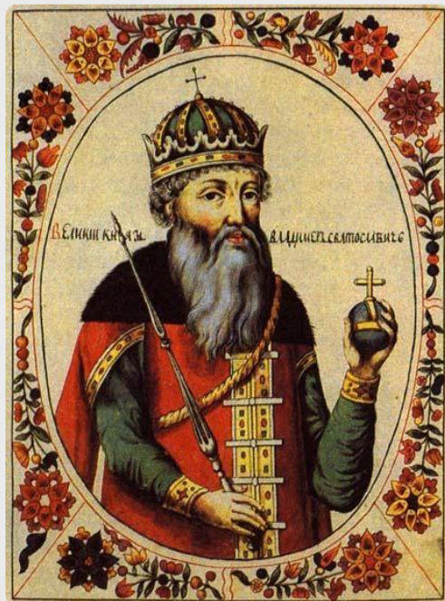
Владимир Красное Солнышко