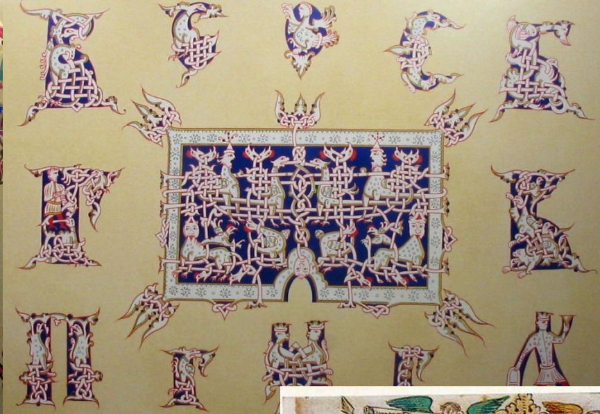
РУССКИЙ ОРНАМЕНТ XIV ВЕКА