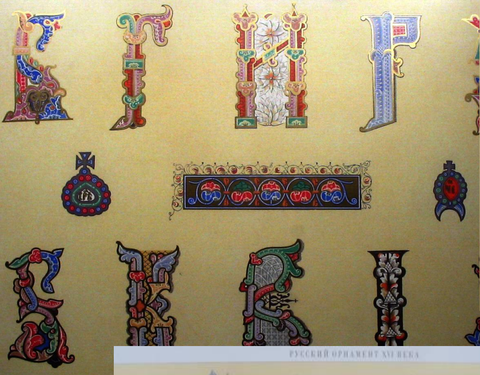
РУССКИЙ ОРНАМЕНТ XVI ВЕКА