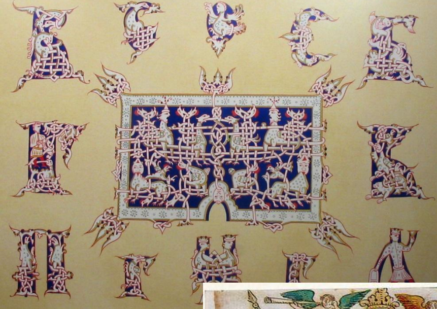
РУССКИЙ ОРНАМЕНТ XIV ВЕКА