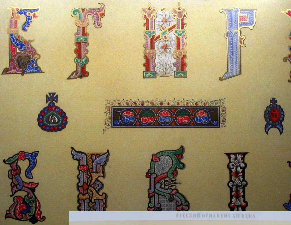
РУССКИЙ ОРНАМЕНТ XVI ВЕКА