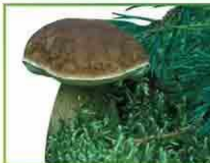
белый гриб (сосновый)