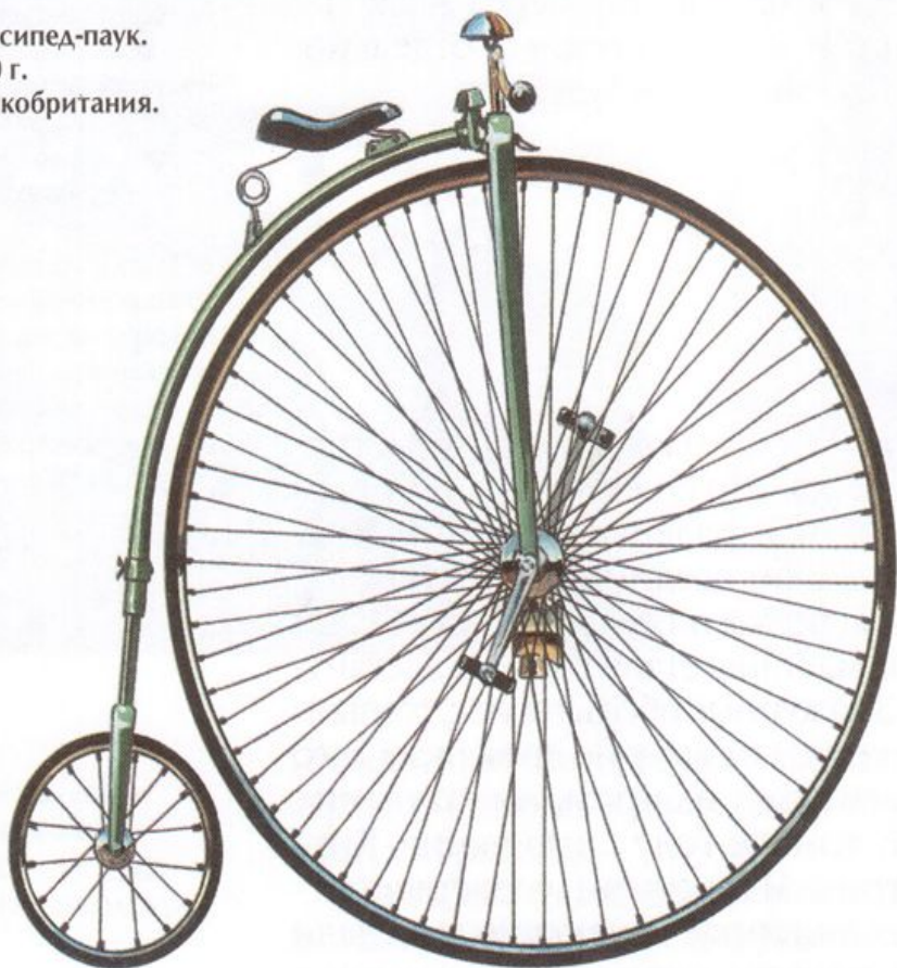
Велосипед-паук. 1880 г. Великобритания.

В том же году англичанин Киркпатрик Макмиллан усовершенствовал новинку: качающиеся педали соединил рычажным механизмом с задним колесом, которое сделал больше переднего, на оба колеса надел железные обручи. Облегчить конструкцию и повысить ее маневренность удалось лишь в 1847 г., когда пустотелыми шинами с надувными камерами лорда Лорена заменили сплошные резиновые шины шотландца Р. Томпсона. В 1853 г. немец Мориц Фишер построил экипаж с педалями на переднем колесе и тормозом на заднем. В Германии французы охотно приняли аналогичную конструкцию парижского каретного мастера Пьеро Мишо, названную в его честь «мишолиной». Примерно в то же время новую машину стали повсеместно называть по-французски – «велосипед» (от лат. velox – «быстрый» и pes – «нога»).