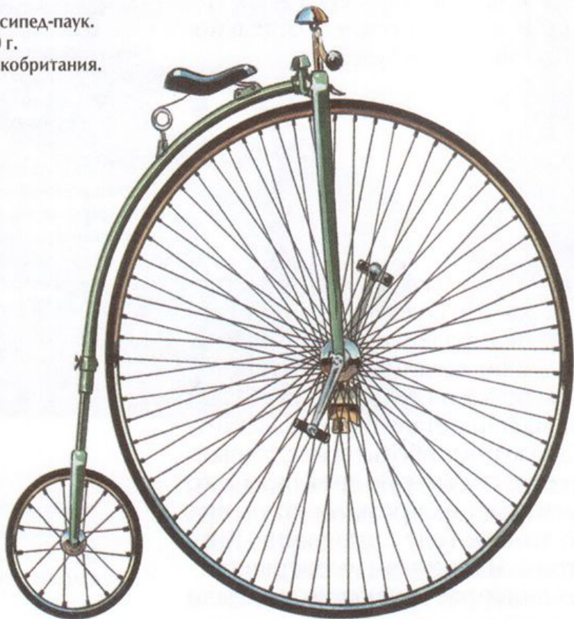
Велосипед-паук. 1880 г. Великобритания.