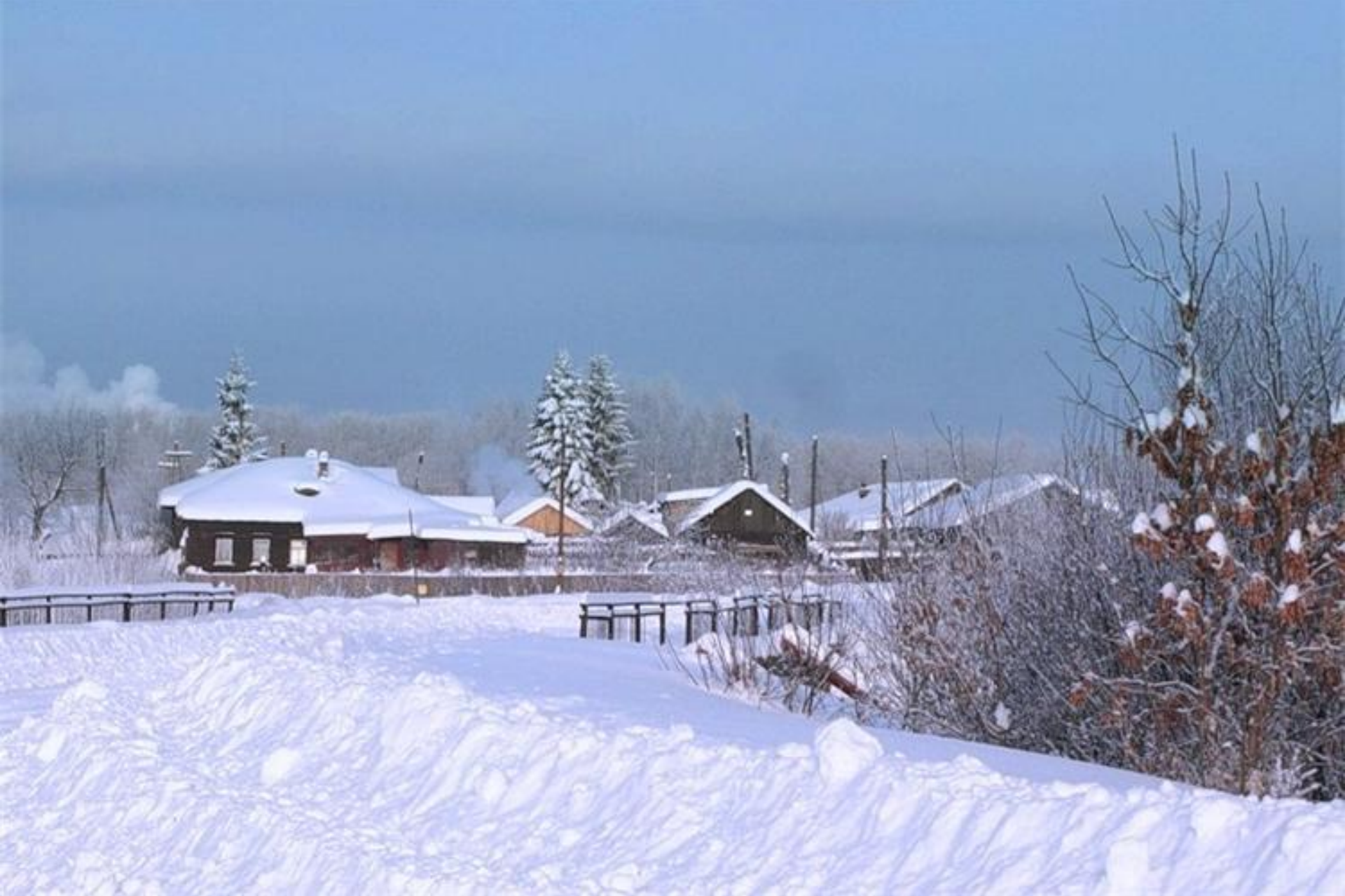
Дымковская слободка сегодня.