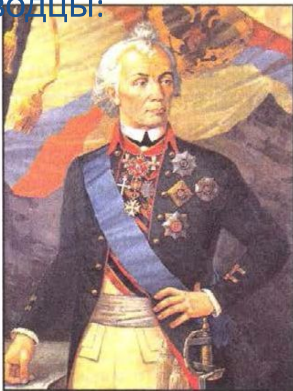
А. В. Суворов

Во время царствования Екатерины Великой блестящие победы одержали русские полководцы: