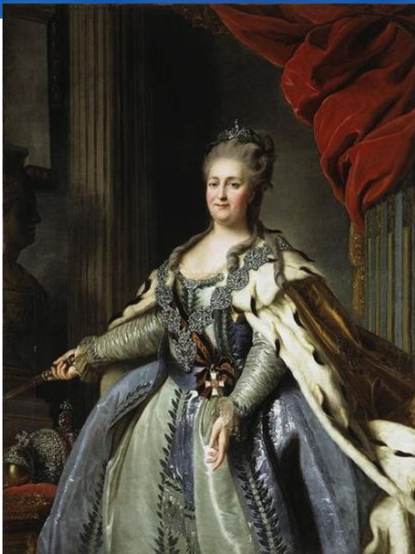
Годы правления 1762 - 1796.

Она славилась искусством управлять государством и выбирать своих приближенных. В делах она принимала за образец Петра Великого и постоянно спрашивала себя: «Как бы поступил в таком случае Петр I?» Екатерина царствовала 34 года. Все это время наполнено громкими победами русских и мудрыми распоряжениями императрицы.