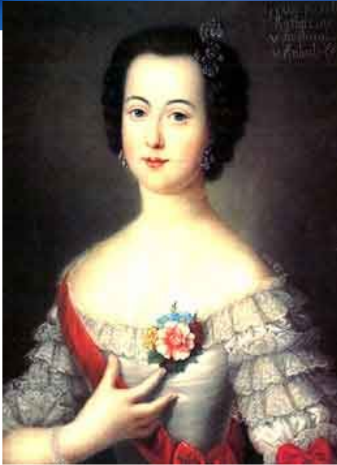
Великая княгиня Екатерина Алексеевна - будущая императрица Екатерина II

Когда в 14 лет Екатерина II переехала в Россию, здесь царствовала Елизавета Петровна. Острый и живой ум, красота немецкой принцессы обратили на себя внимание императрицы.