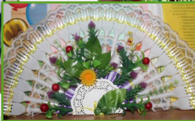
Семья Маркеловых «Веер»