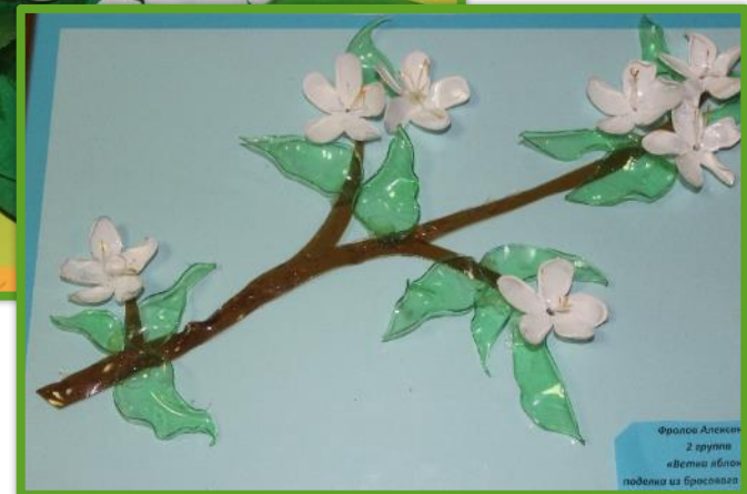
Семья Кремер «Ветка яблони»