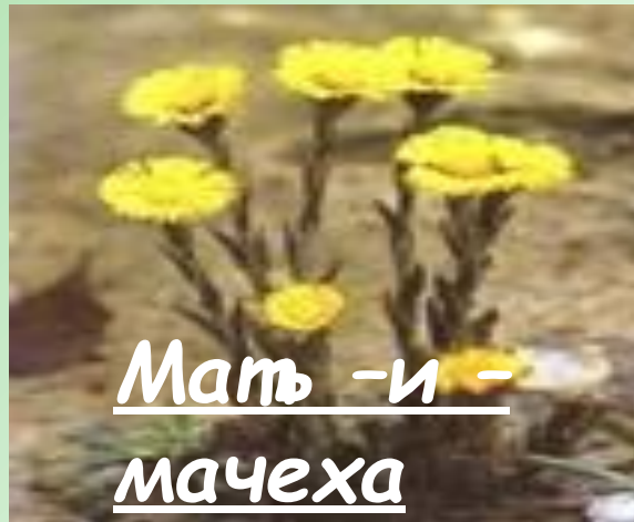
Мать -и - мачеха