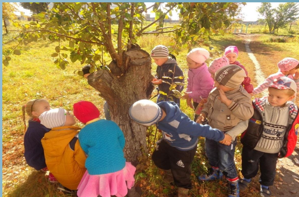
Старый дедушка пенёк