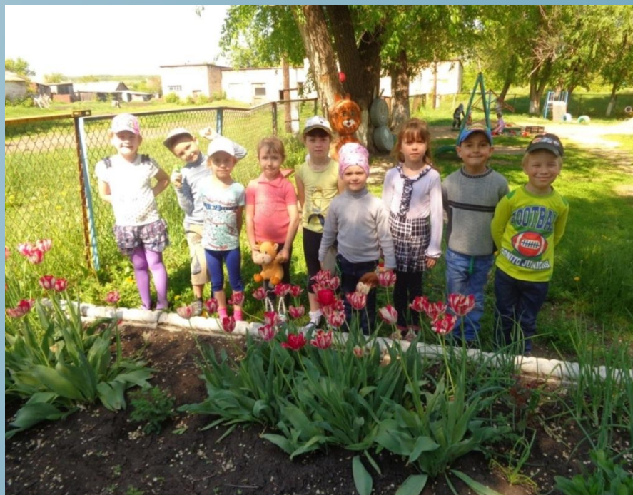
Клумба. Наблюдение за цветением тюльпанов.