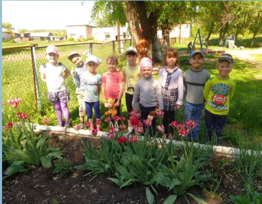
Клумба. Наблюдение за цветением тюльпанов.