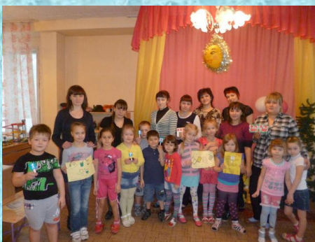
Дети 5 – 7 лет