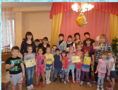
Дети 5 – 7 лет