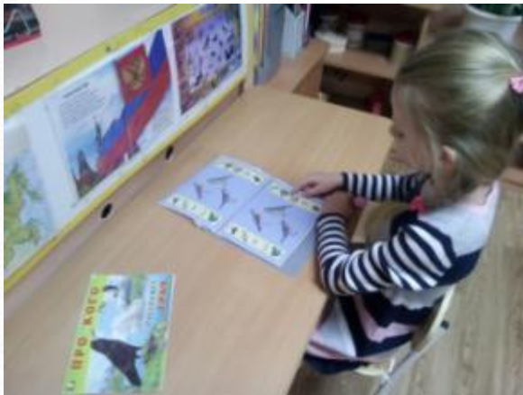
Дидактическая игра «Птичья столовая»

Театрализованная игра «Где обедал воробей?»