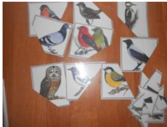
Дидактическая игра «Чей хвост?»