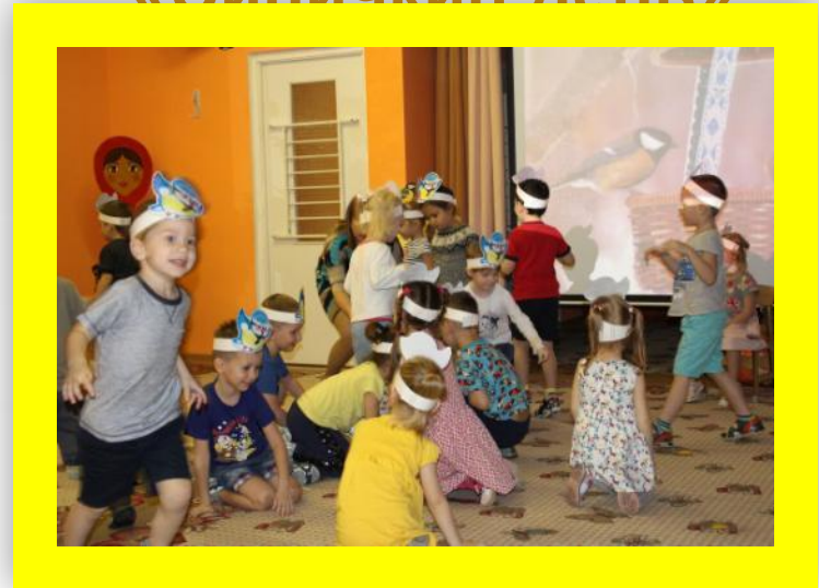
Досуг «Весёлые превращения»