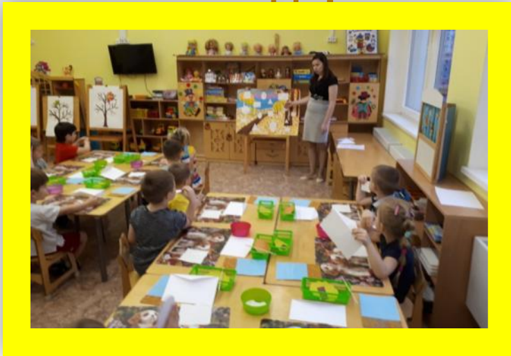
Открытое занятие «Осенние деревья»