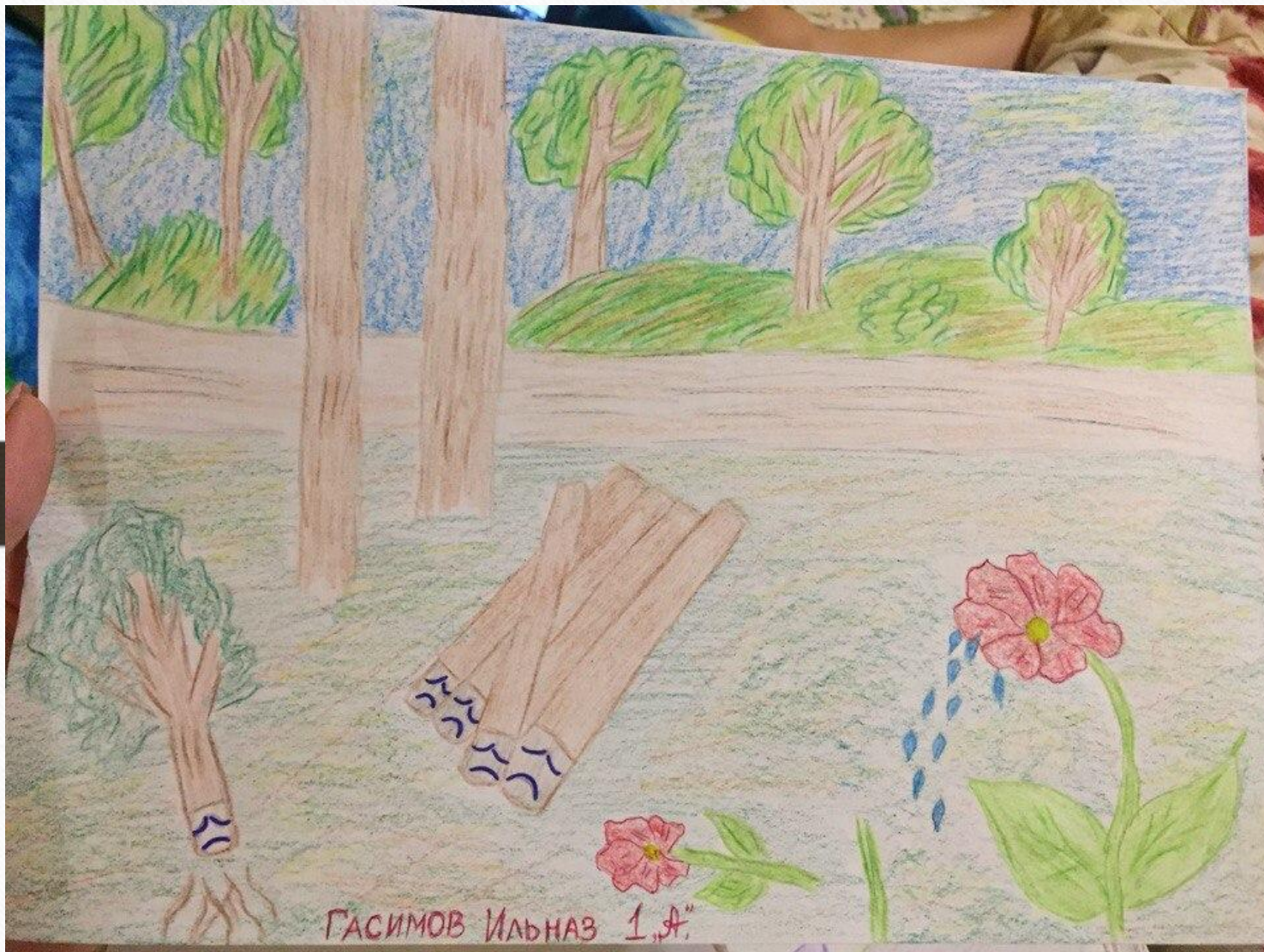
ГАСИМОВ Ильназ 1,А