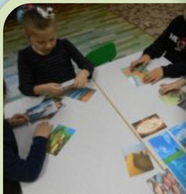
«Живое - неживое»