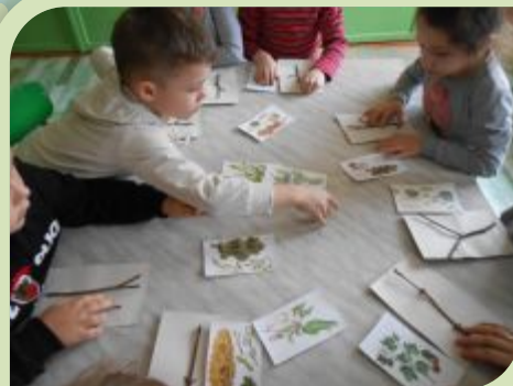
«Ветка, ветка, чья ты детка»