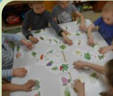
«Вершки - корешки»