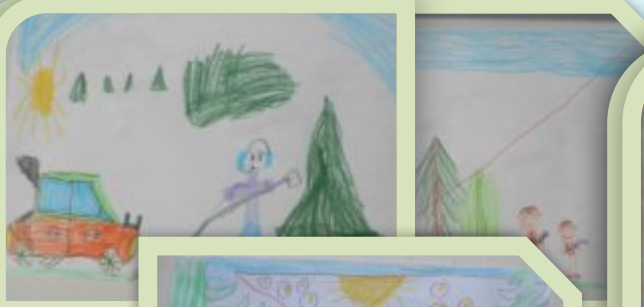
«Придумай новый экологический знак»