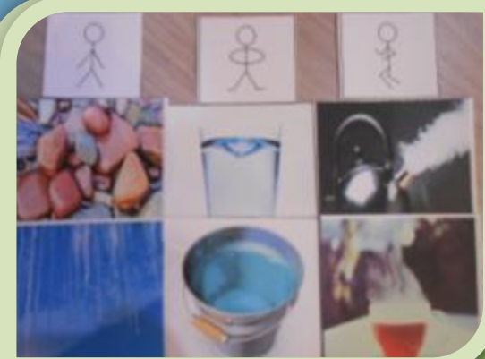
Метод маленьких человечков»