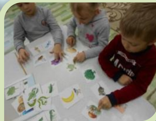
«Воздух, земля, вода»