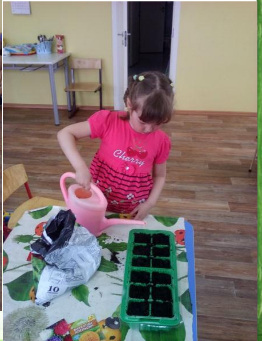
Посев семян ранней весной