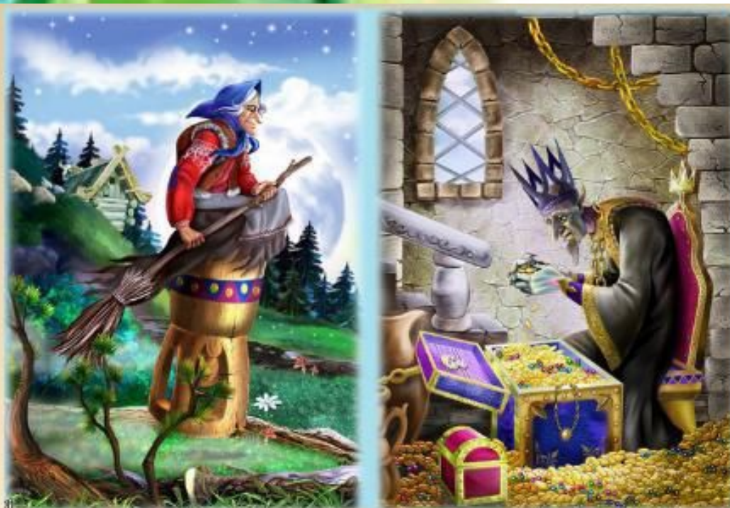
Сказка «Кощей Бессмертный»