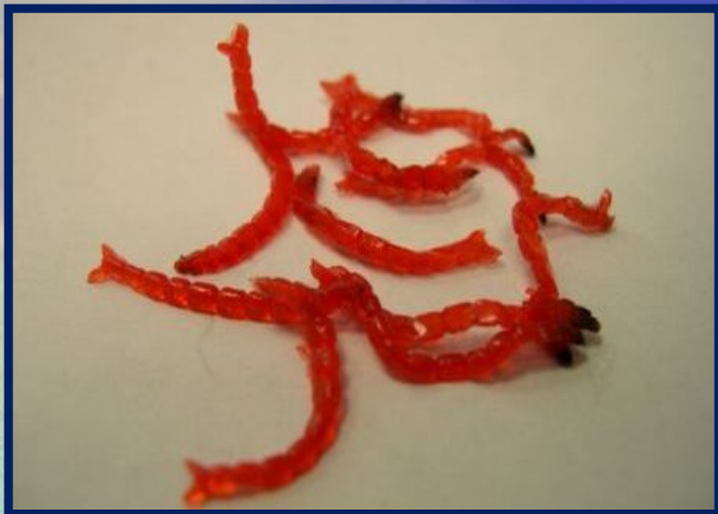
мотыль – личинки комаров