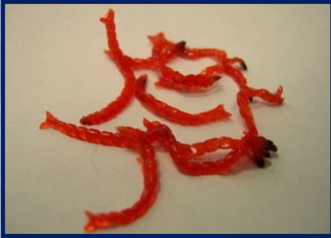
мотыль – личинки комаров