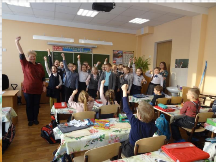
Вместе дети сделали физкультминутку