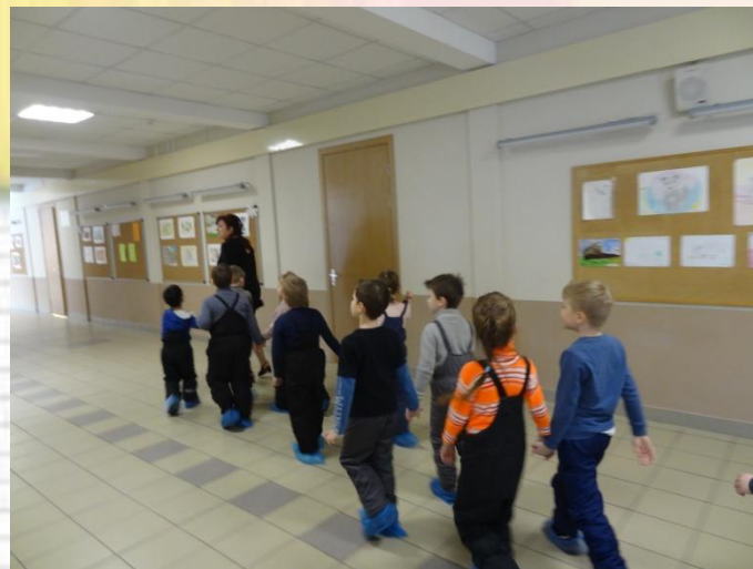
Нас провели в начальную школу