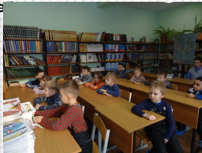
Детям показали библиотеку