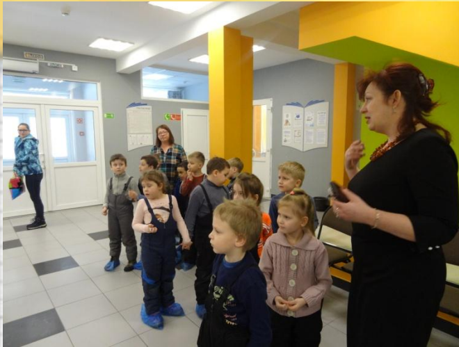
Красивый яркий холл при входе