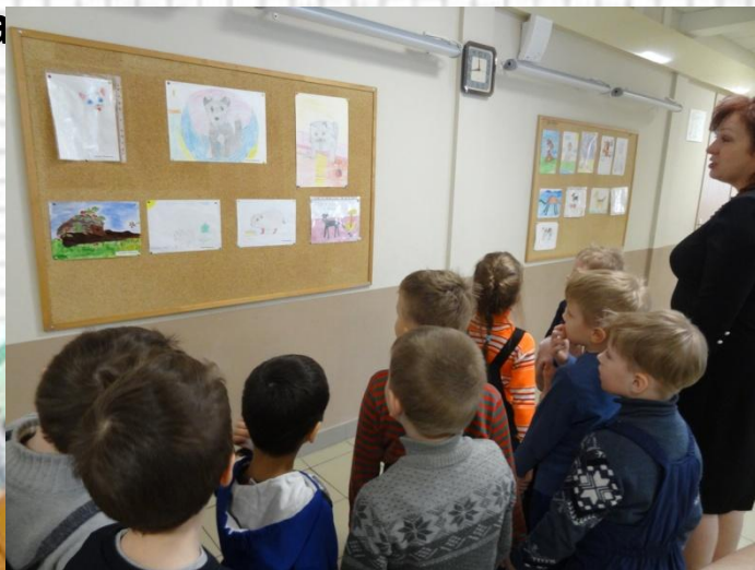
Выставка детских рисунков