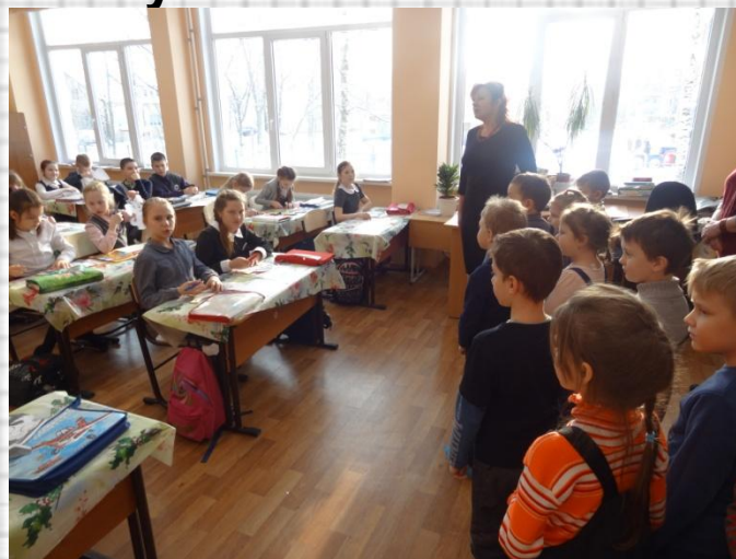
Мы зашли на урок технологии