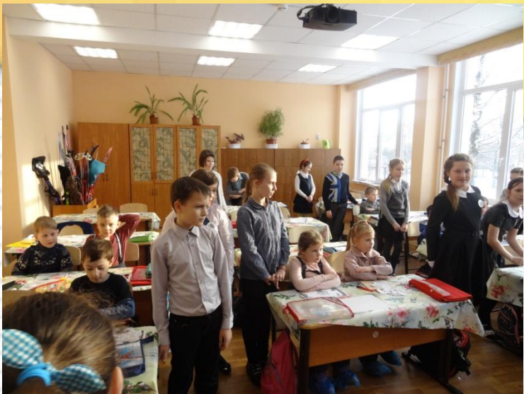
Школьники уступили свои места