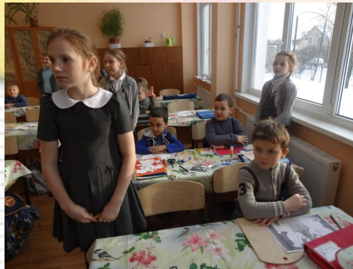
Будущие первоклассники почувствовали себя