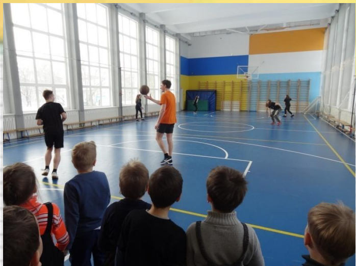
Детям показали спортивный зал, в котором шел урок у ста