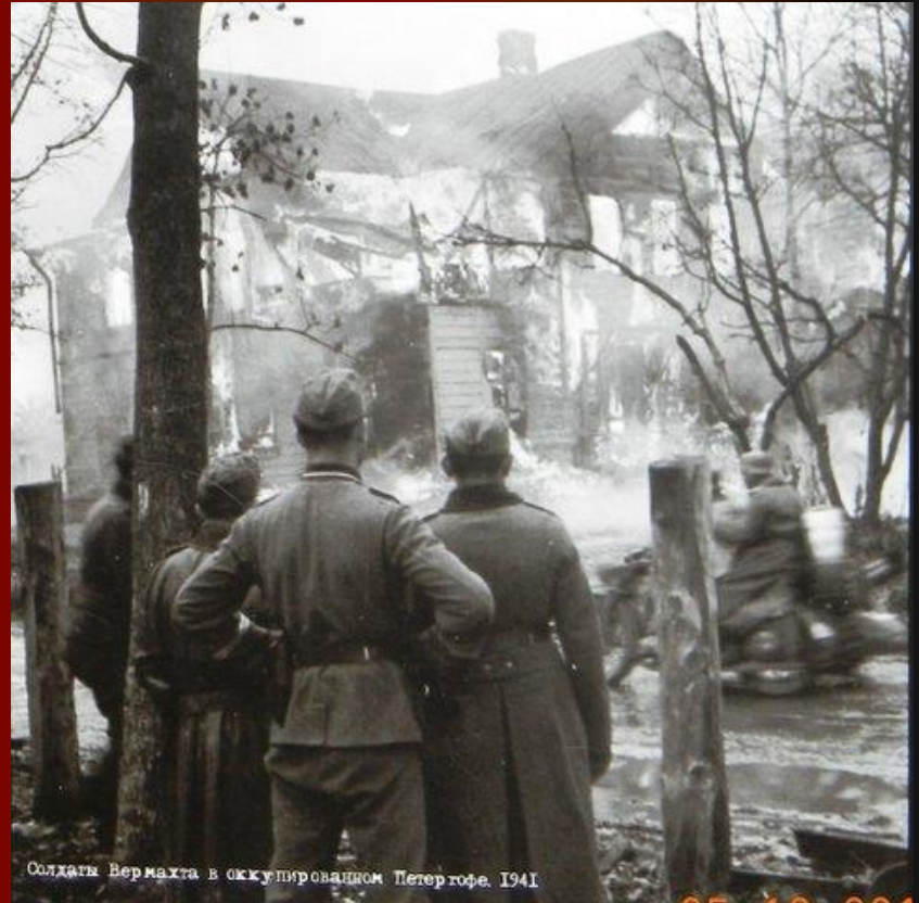
Солдаты Вермахта в оккупированном Петергофе. 1941