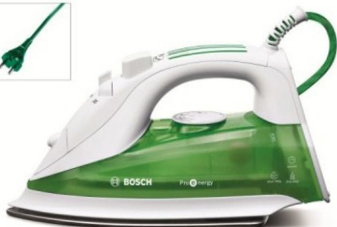
TDA7650 Oktober 2009