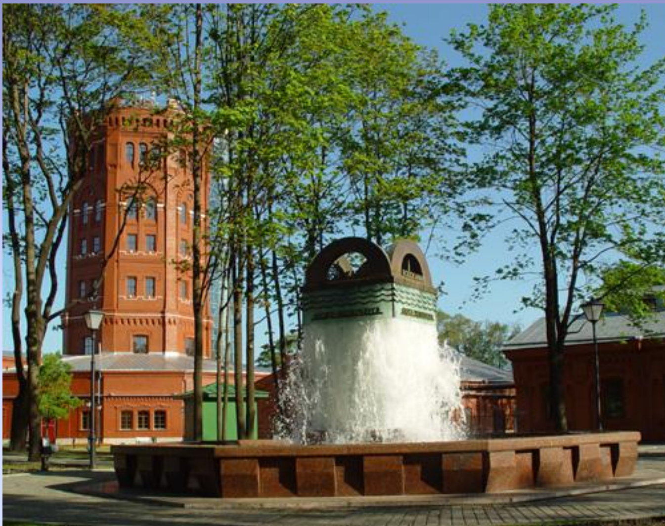
Музей воды в Санкт-Петербурге