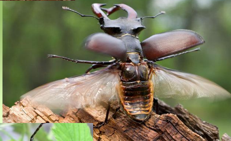
Голова жука-олени