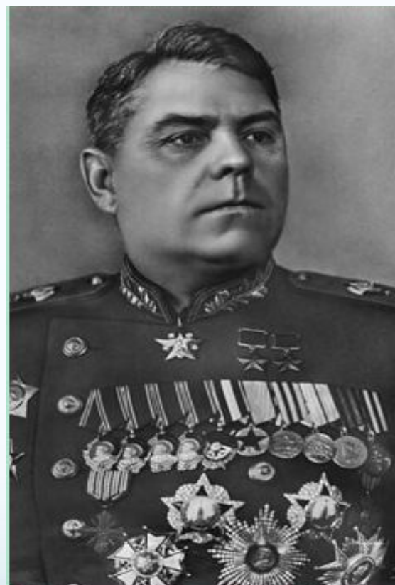
Александр Фёдорович Можайский