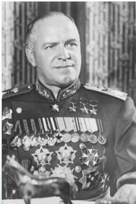
Жуков Георгий Константинович