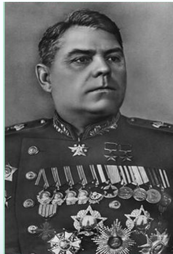
Александр Фёдорович Можайский