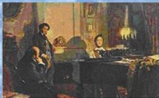
А.С. Пушкин и В.А. Жуковский у М.И. Глинки Художник В. Артамонов

В отличие от гербов и флагов, которые были символами государств ещё в глубокой древности, гимны, как государственные символы. Появились сравнительно недавно.