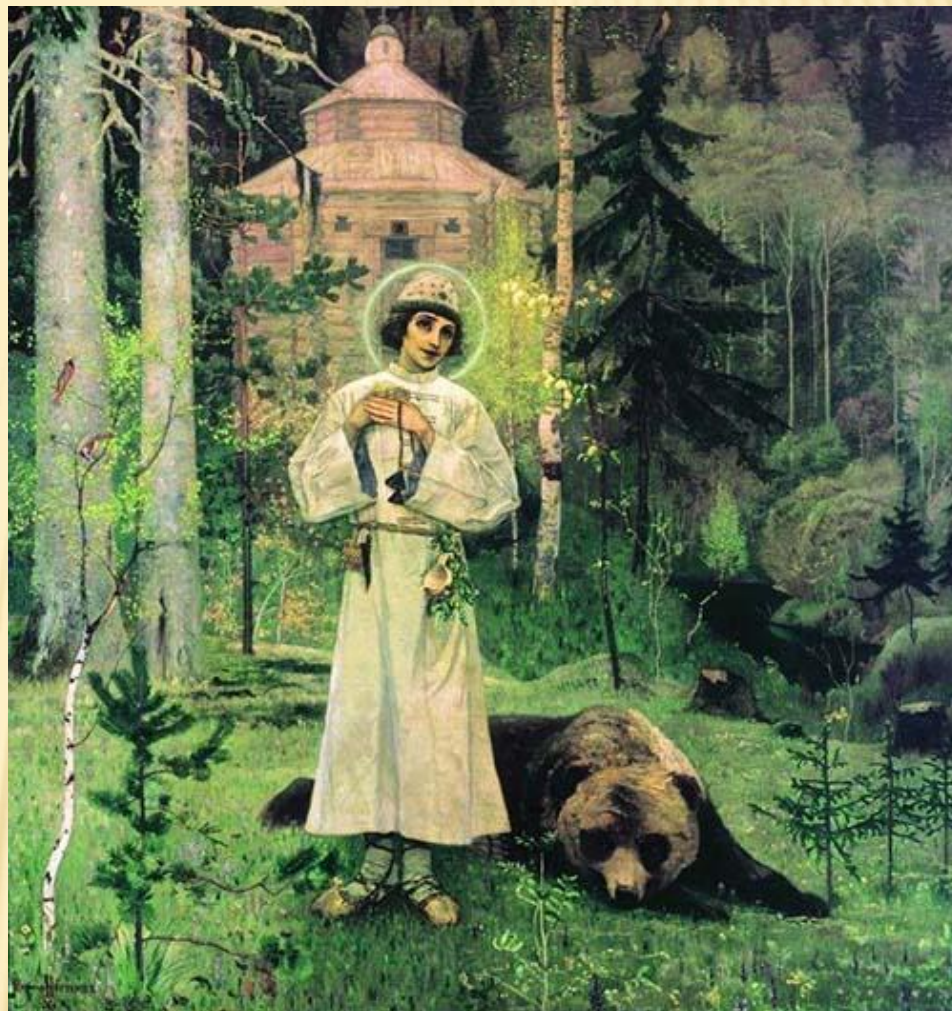
М. НЕСТЕРОВ «ЮНОСТЬ ПРЕПОДОБНОГО СЕРГИЯ»

Трудно было в лесу. Вокруг его кельи были волки, бродил медведь. Бывало Варфоломей и холодно, и голодно, посещали его страшные мысли. Зверей он не боялся: с медведем делился своим хлебом, а от страхов защищался молитвой. Всё выдержал Варфоломей и, наконец, тоже стал монахом.