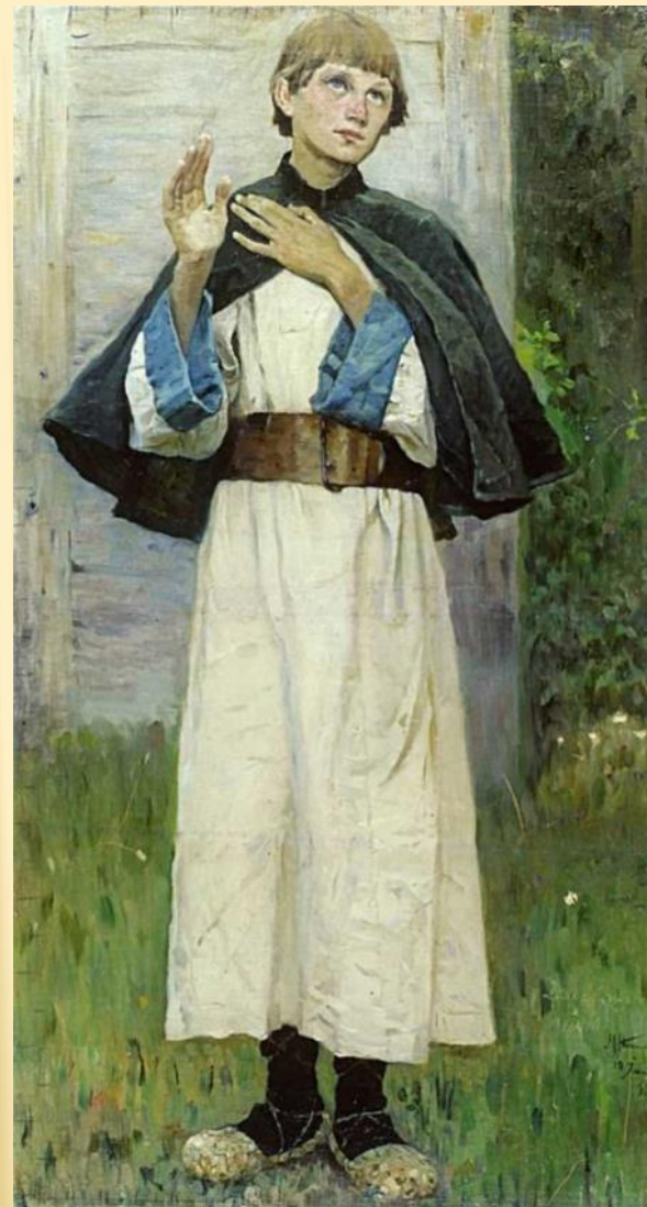
М. НЕСТЕРОВ «ЮНОСТЬ СЕРГИЯ»

Доброму гостю в этом доме всегда рады. «Проходи, добрый человек, садись за трапезу». «Спаси бог вас, люди добрые, помолимся ему всевышнему. А ты, Варфоломей, бери книгу, читай псалтырь». «Я не умею, старче, не даётся мне наука». «Читай, читай не робей, чадо» Варфоломей взял в руки книгу и, вдруг, начал читать. Да так хорошо, что все изумились, а старец сказал родителям : «Ваш сын будет велик перед господом». Прошло время, и слова старца монаха исполнились, юношей ушел Варфоломей в лес, срубил там избушку и стал проводить там всё время в посте и молитве.