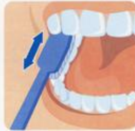
4. Жевательная поверхность зубов