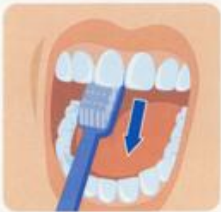
3. Внутренние поверхности передних зубов