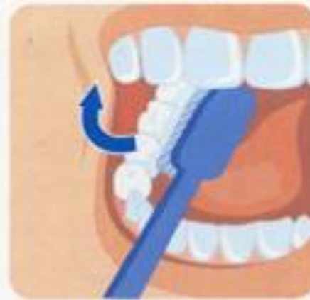
2. Внутренние поверхности зубов