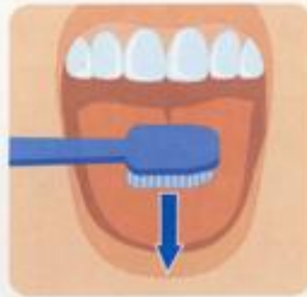
6. Чистка языка