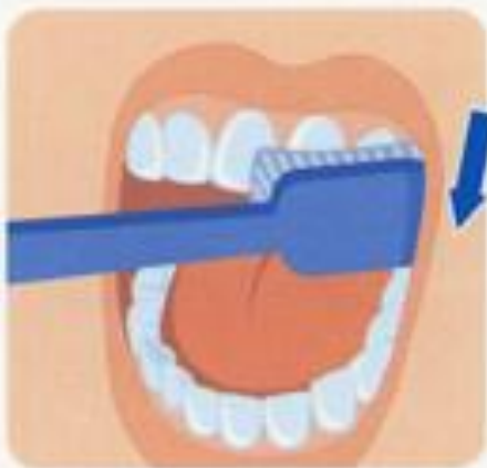
1. Наружные поверхности зубов