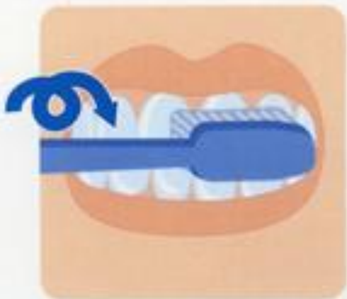
5. Массаж десен