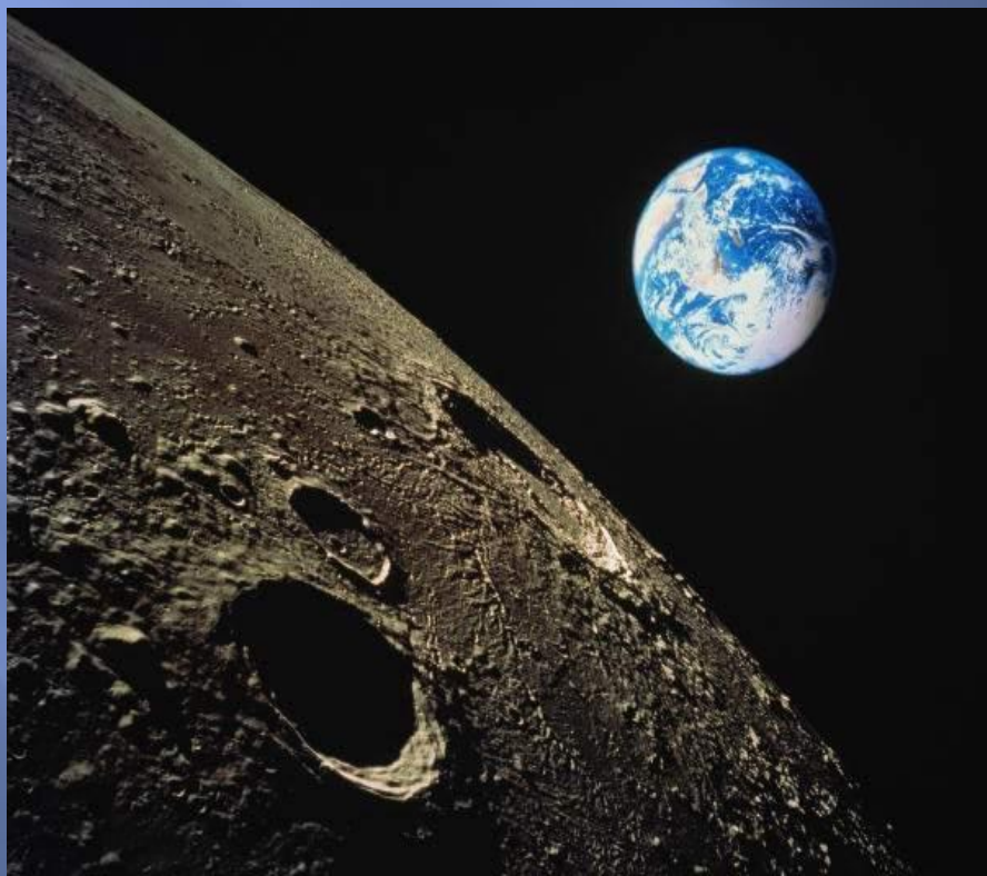
ФОТО ЗЕМЛИ С ЛУНЫ