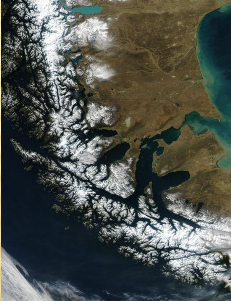
Спутниковая (MODIS) фотография Магелланова пролива