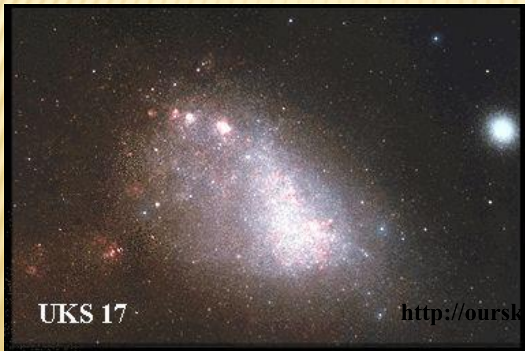
Малое Магелланово облако.

Млечного пути. Видны невооруженным глазом в Южном Полушарии. Названы в честь Фернандо Магеллана, впервые увидевшего их в 1519 году во время кругосветного путешествия.