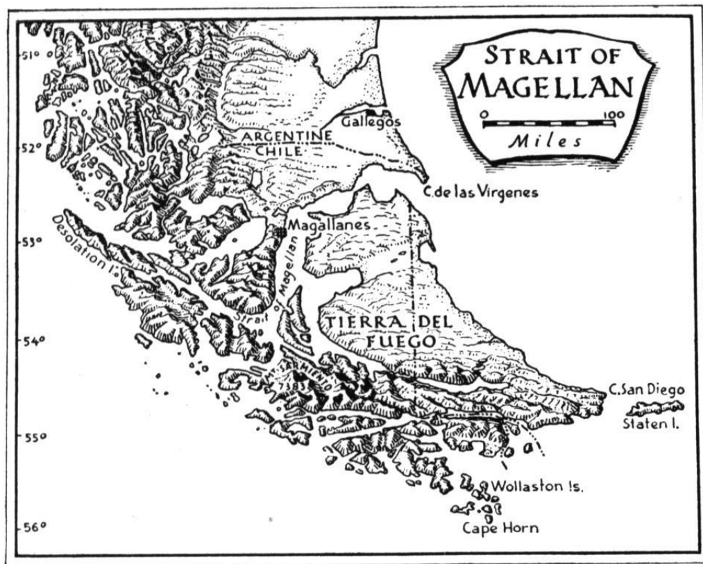
□ Карта XVII века