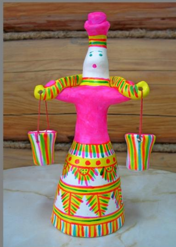
барыня с ведрами

У неё высокая колоколообразная юбка с расширением к низу. Верхняя часть туловища по сравнению с ней кажется меньше. Маленькая голова заканчивается изящной шляпкой.