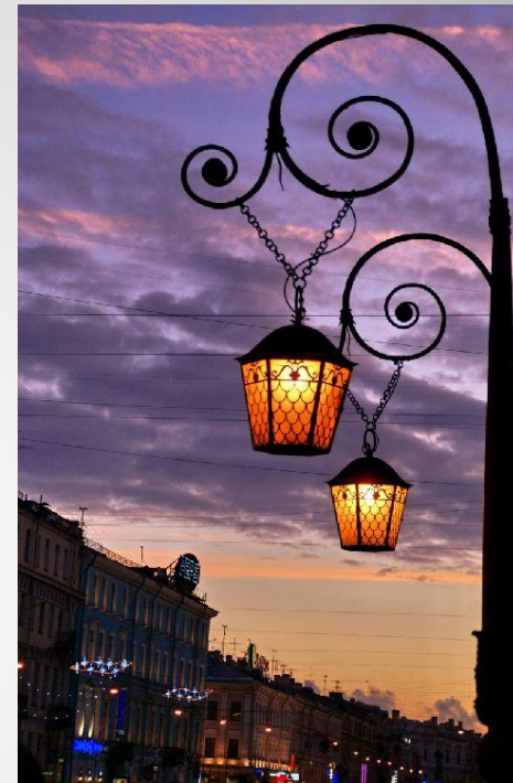
Фонарь на Итальянском мосту