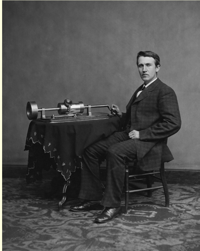
Томас Алва Эдисон (1847 – 1931)