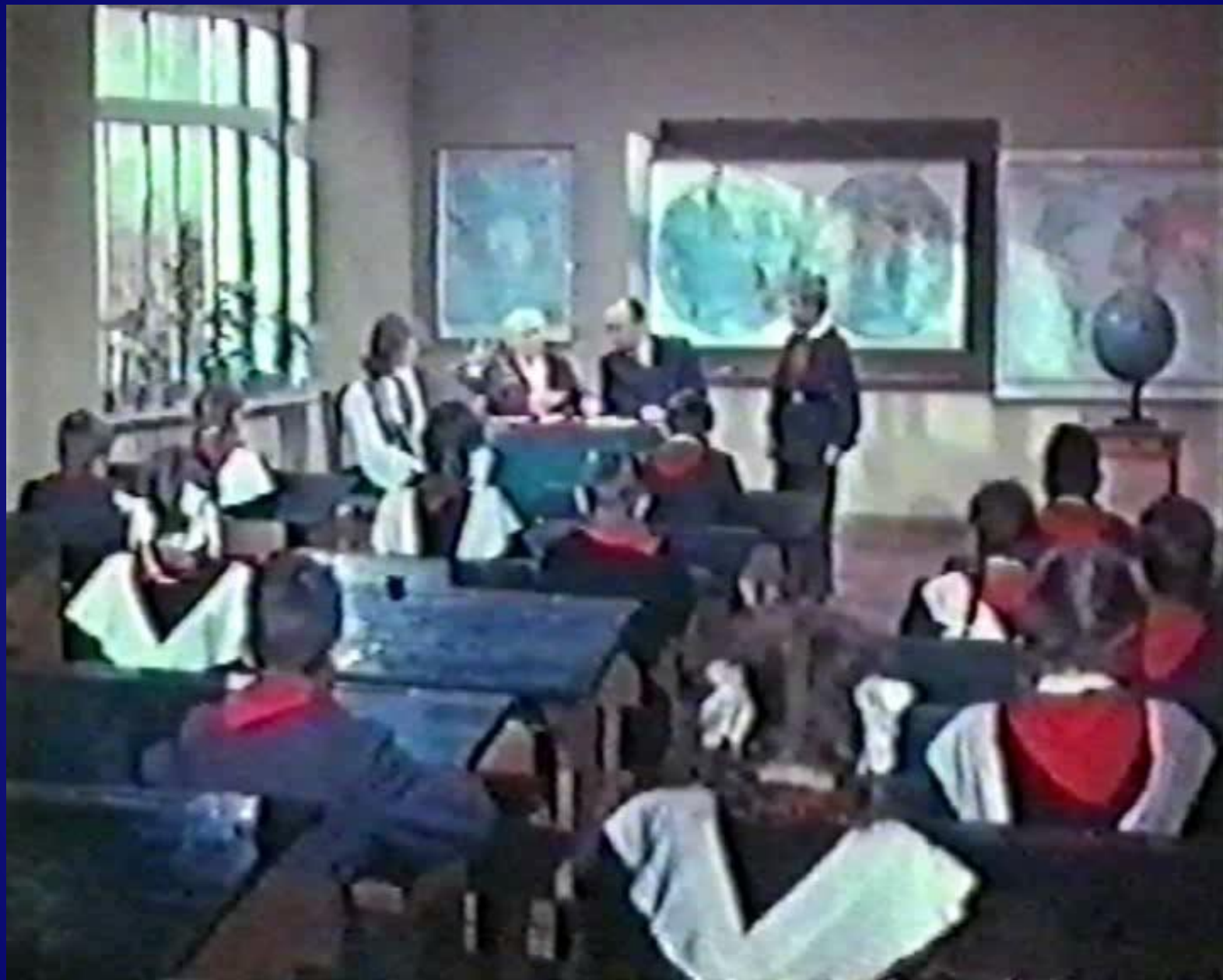
Кадры из кинофильма «Старик Хоттабыч»