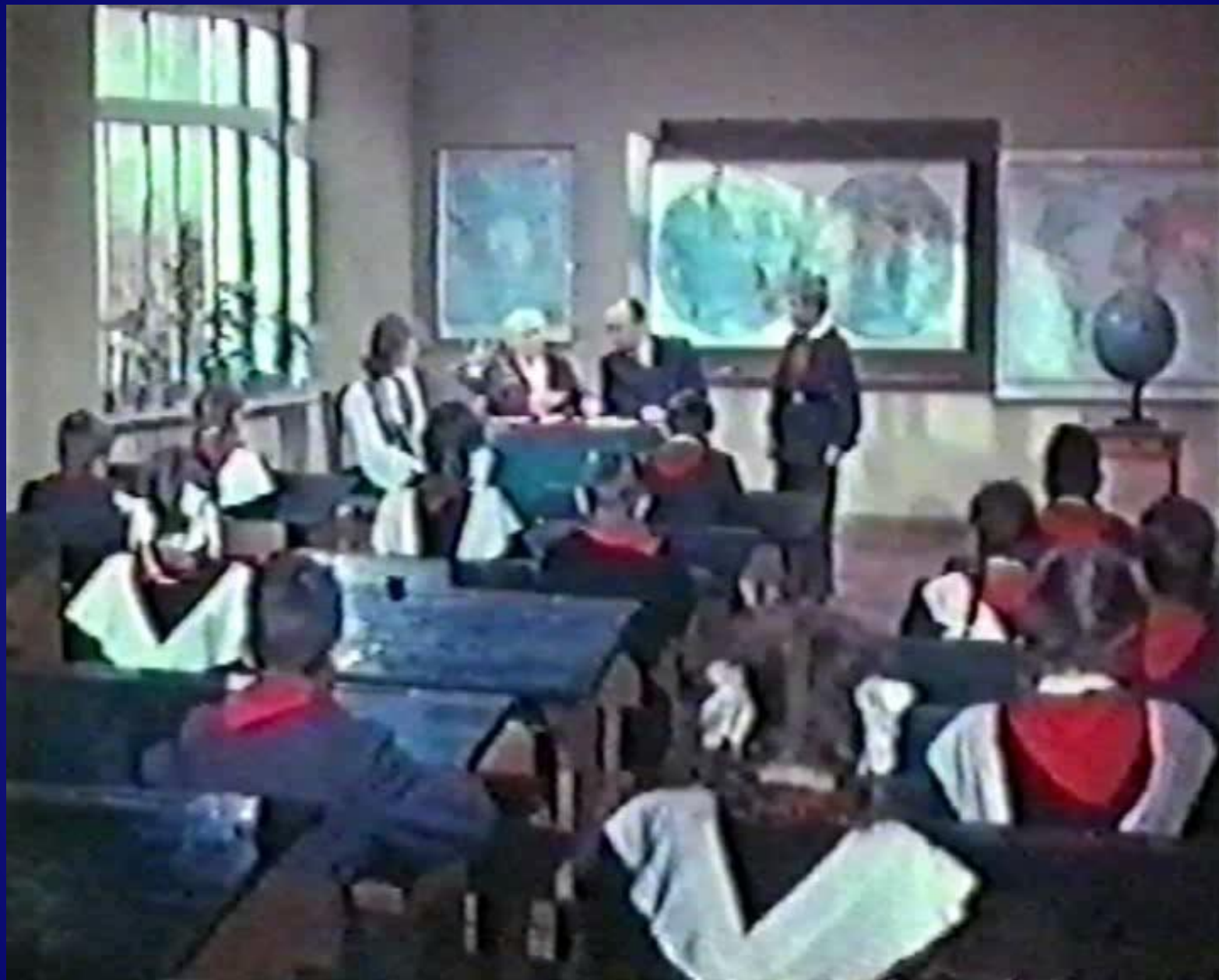
Кадры из кинофильма «Старик Хоттабыч»