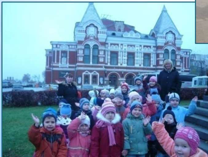
Драматический театр им. М.Горького