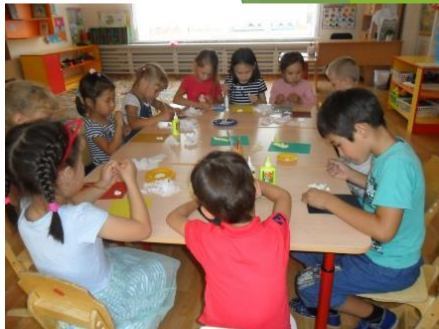
Апликация на тему «Колосок»