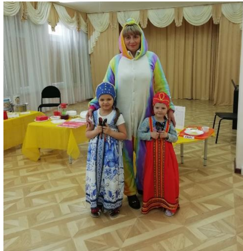
Встреча гостей на «Недели открытых дверей»