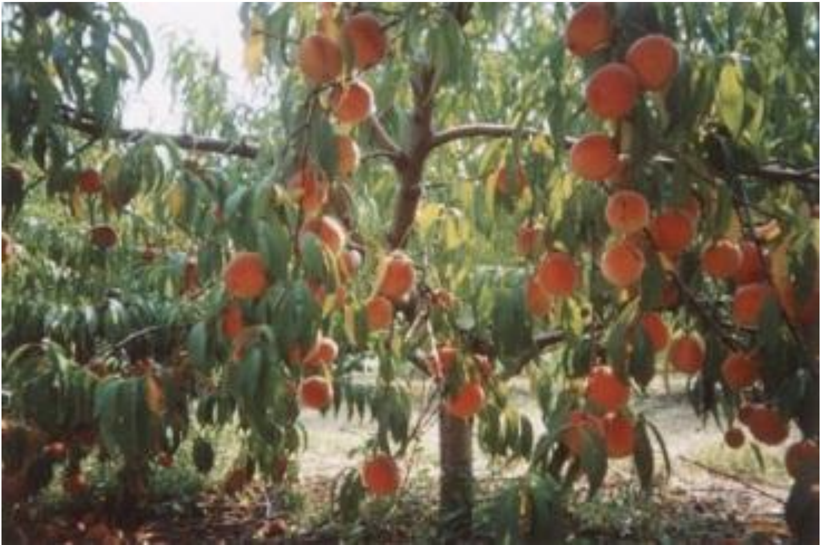
Персики на дереве.