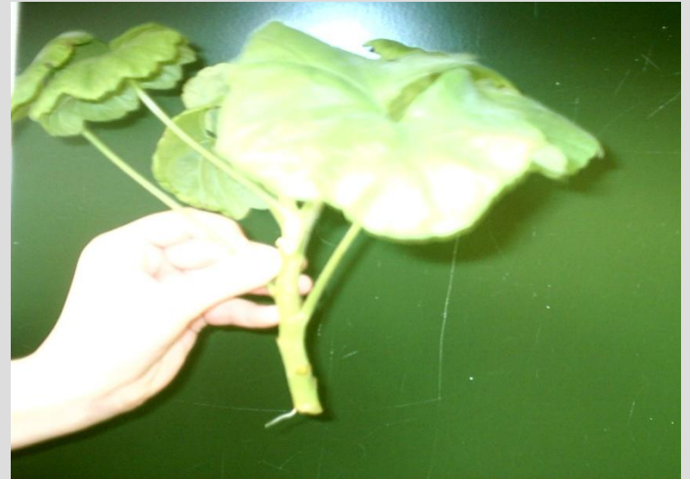
Черенок, который стоял в воде в тёплом месте, через неделю дал корешок