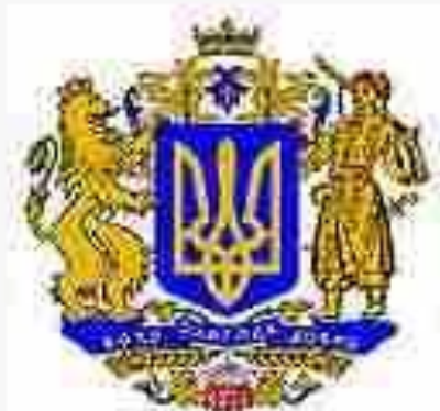
Проект Великого герба України авторського колективу О.Івахненка (1996)