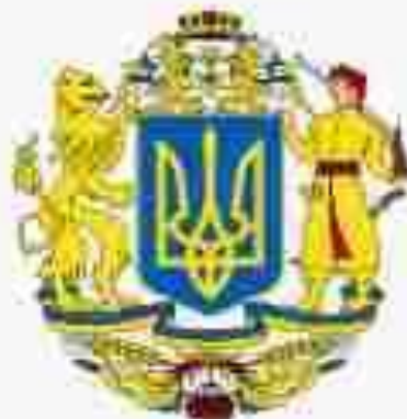
Проект Великого герба України авторського колективу О.Івахненка (2001)