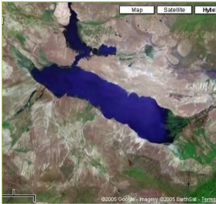
Вид из космоса