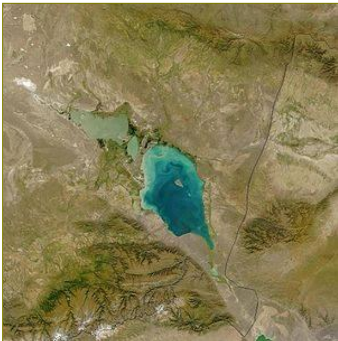
Вид из космоса