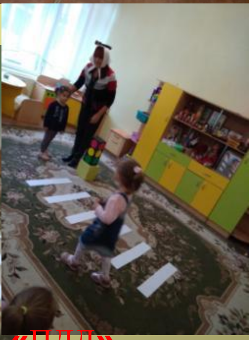
Наш «Веселый Светофор»