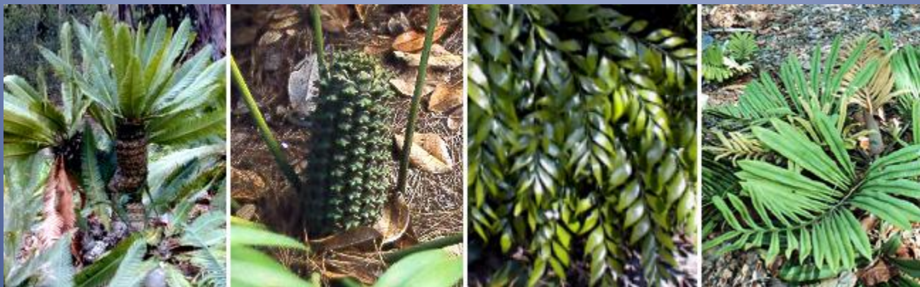
Саговниковые. Слева направо: дион съедобный, цератозамия мексиканская (женская шишка), бовения мелкопильчатая, стангерия.

Саговниковые – двудомные растения; на каждой особи образуются репродуктивные органы исключительно одного пола. Мужские шишки имеют длину до 80 см, женские – до 1 м (у африканского саговника; весят шишки при этом до 40 кг). Сперматозоиды цератозамы мексиканской видны невооружённым глазом. Пыльцевое зерно прорастает вглубь семяпочки; жгутиковые сперматозоиды подплывают по образовавшейся пыльцевой трубке и сливаются с яйцеклетками. Яйцеклетка после оплодотворения развивается в семя с ярко окрашенной мясистой наружной кожурой; внутри кожуры находится «косточка», защищающая эндосперм с зародышем.