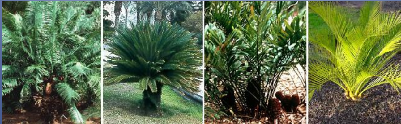
Саговниковые. Слева направо: саговник завитой, саговник отвёрнутый, замия флоридская, макрозамя обыкновенная.

Внешне похожие на пальмы саговниковые (Cycadophyta), относившиеся ранее к голосеменным, теперь обычно выделяются в собственный отдел. Иногда к ним же относят семенные папоротники , от которых они и произошли, и беннеттиты . Настоящие саговниковые ( цикадовые ) объединяют в одно семейство с 9–10 родами и сотней видов в тропиках и субтропиках обоих полушарий.