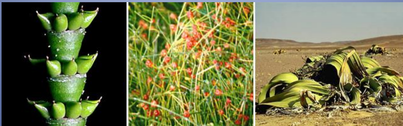
Гнетовые. Слева направо: гнетум, хвойник, вельвичия.

Отдел гнетовых (Gnetophyta) содержит три своеобразных семейства голосеменных растений с неясными эволюционными связями. Растения рода гнетум – тропические лианы. Эфедровые (хвойники) – пустынные кустарники с чешуевидными листьями. Вельвичия – единственный представитель семейства вельвичиевых – имеет погруженный в песок стебель, от которого отходят два огромных лентовидных листа.