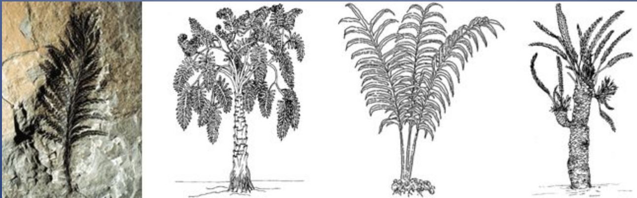
Вымершие голосеменные. Слева направо: отпечаток археоптериса (прогимносперм), медуллоза, полиподиум (семенной папоротник), вильямсония (беннеттит).

Ещё одним вымершим отделом голосеменных, известным с карбона, являются беннеттитовые (Bennettitophyta или Cycadeoideophyta). Некоторые исследователи относят эти растения к саговникам, от которых они отличаются органами размножения. Все беннеттитовые имеют обоеполые стробилы, напоминающие цветок наиболее примитивных покрытосеменных. Беннеттитовые вымерли в конце мелового периода (Bennettitophyta или Cycadeoideophyta). Некоторые исследователи относят эти растения к саговникам, от которых они отличаются органами размножения. Все беннеттитовые имеют обоеполые стробилы, напоминающие цветок наиболее примитивных покрытосеменных. Беннеттитовые вымерли в конце мелового периода вместе с динозаврами .