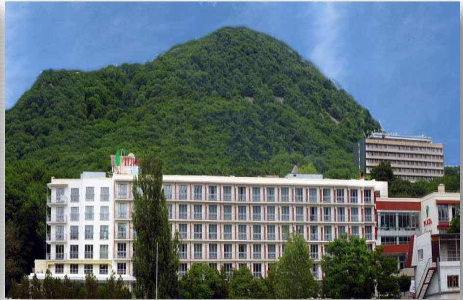
Санаторий им. Э. Тельмана (1907г. постройки)