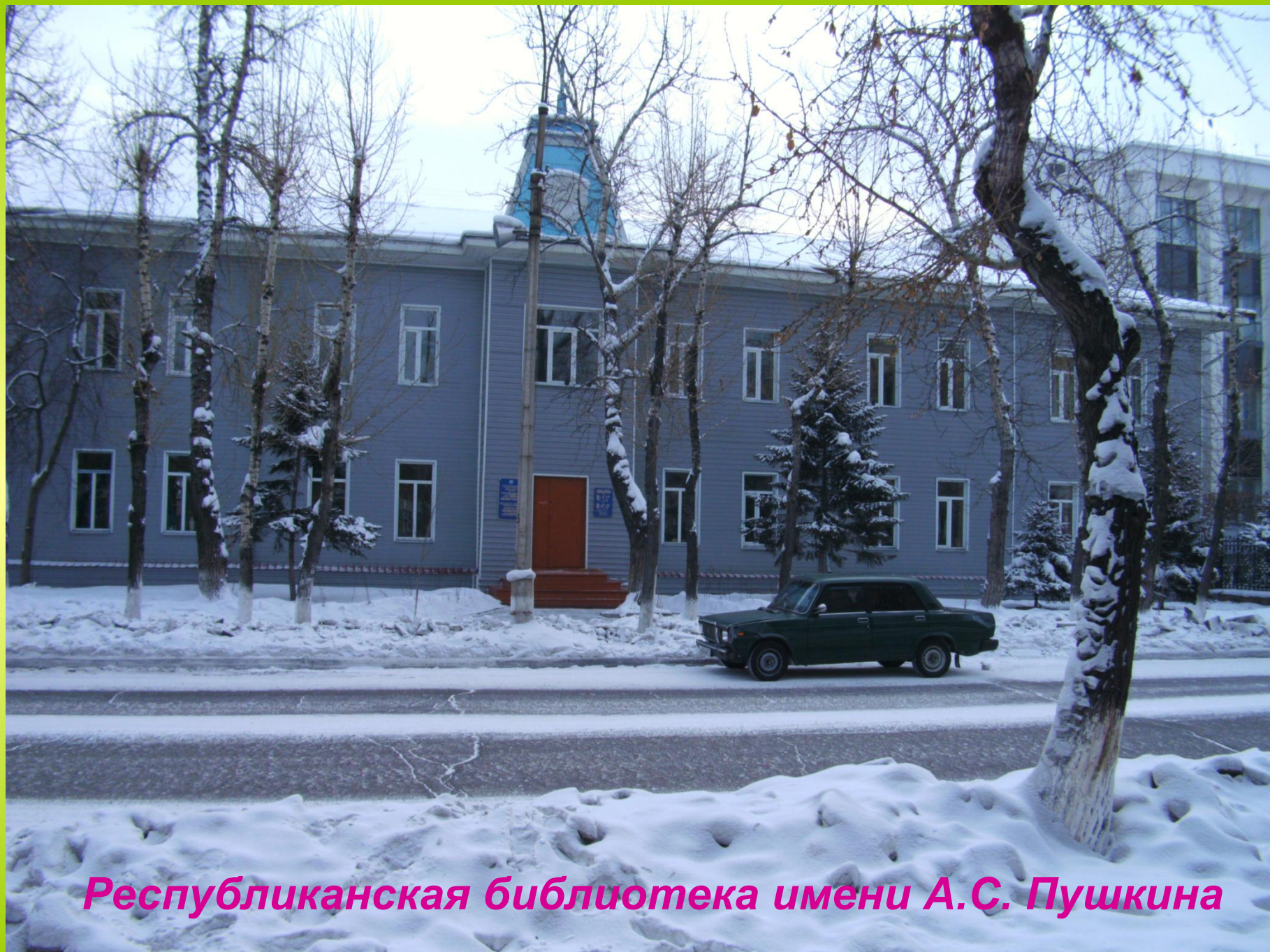
Республиканская библиотека имени А.С. Пушкина