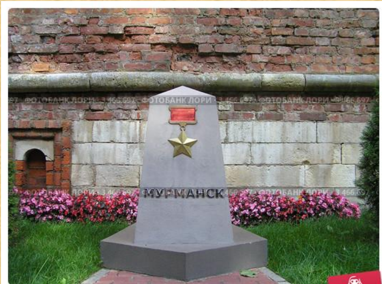
Памятник городу-герою Мурманску г. Смоленск "Аллея Городов-Героев"