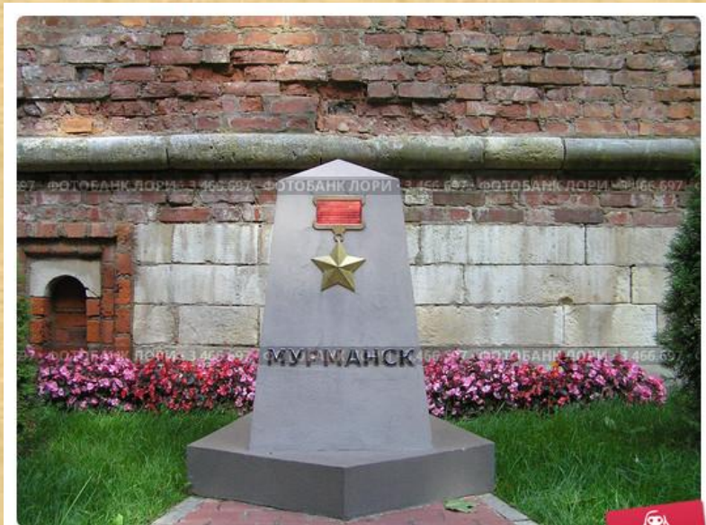
Памятник городу-герою Мурманску г. Смоленск "Аллея Городов-Героев"