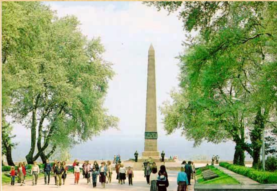
Памятник Неизвестному Матросу и Вечный огонь на Аллее Славы