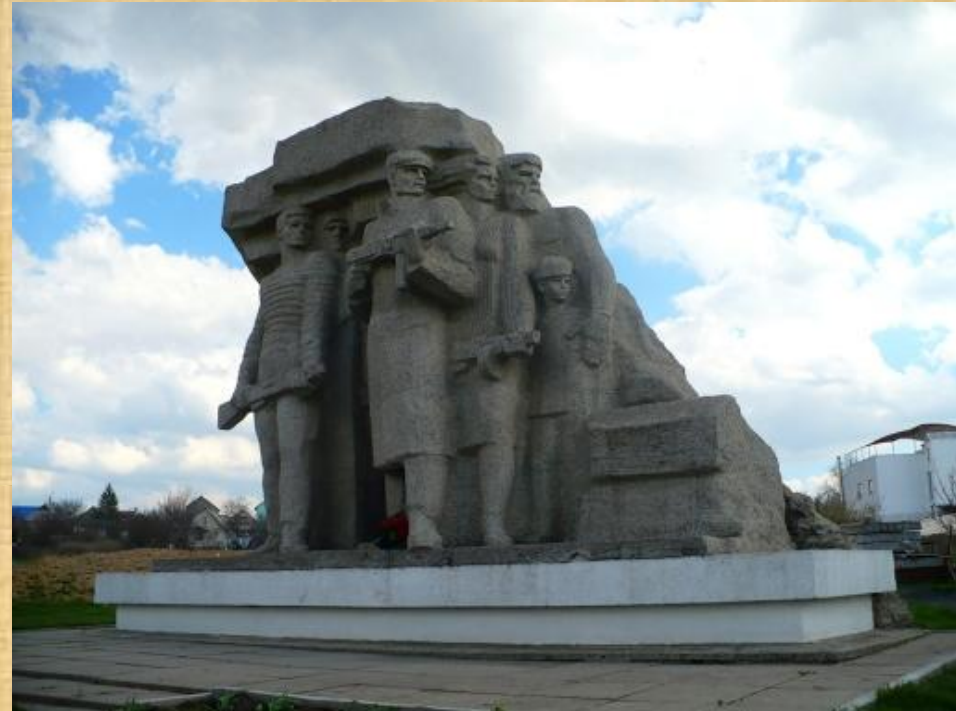
Памятник «Народные мстители»

В память о тех героических событиях вдоль линии главного оборонного рубежа был создан «Пояс Славы» из 11 монументов в различных населенных пунктах, в которых происходили самые ожесточенные бои.