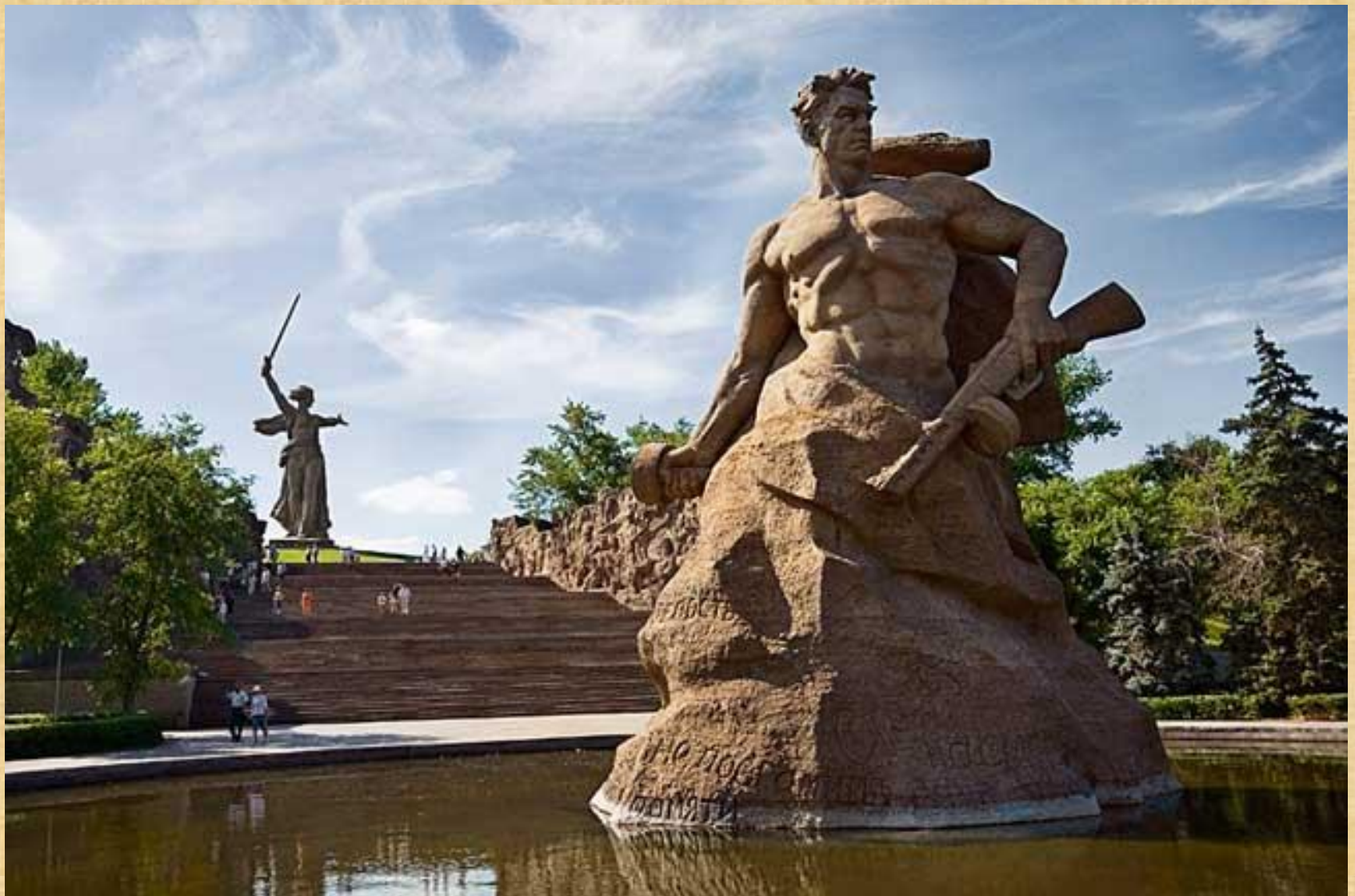
Напротив установлена скульптура воинам-защитникам «Стоять насмерть!»