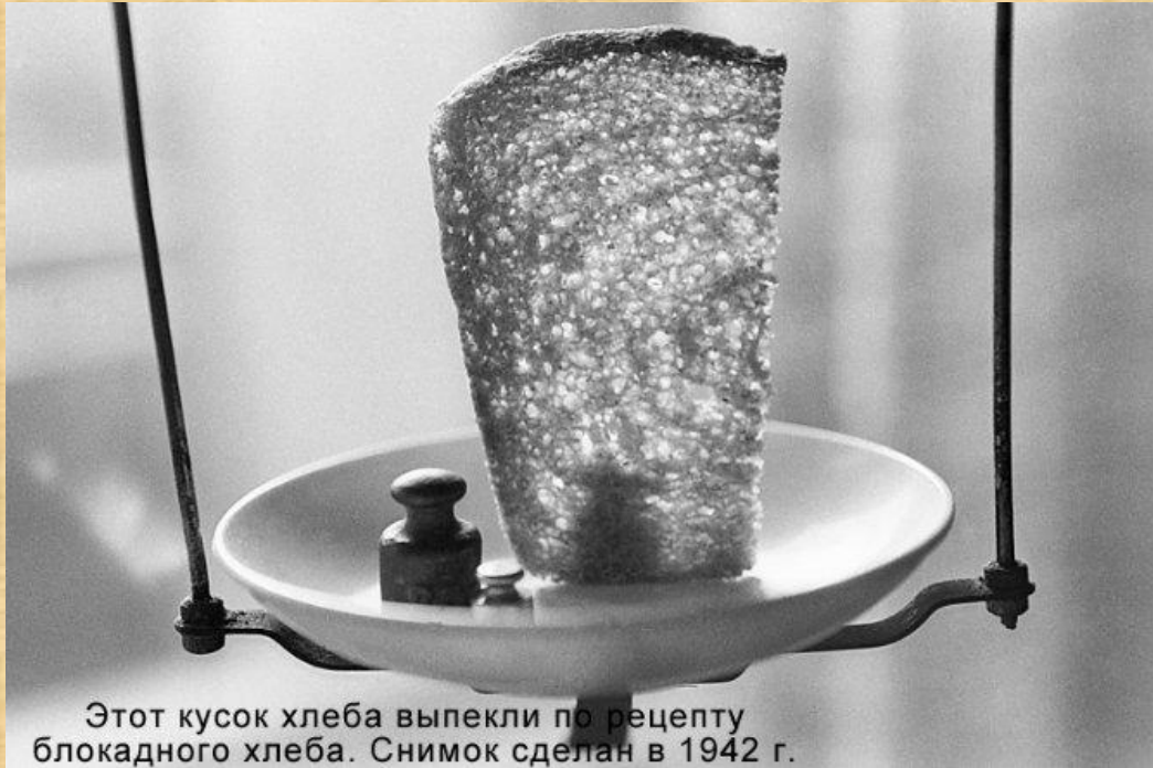
Этот кусок хлеба выпекли по рецепту блокадного хлеба. Снимок сделан в 1942 г.