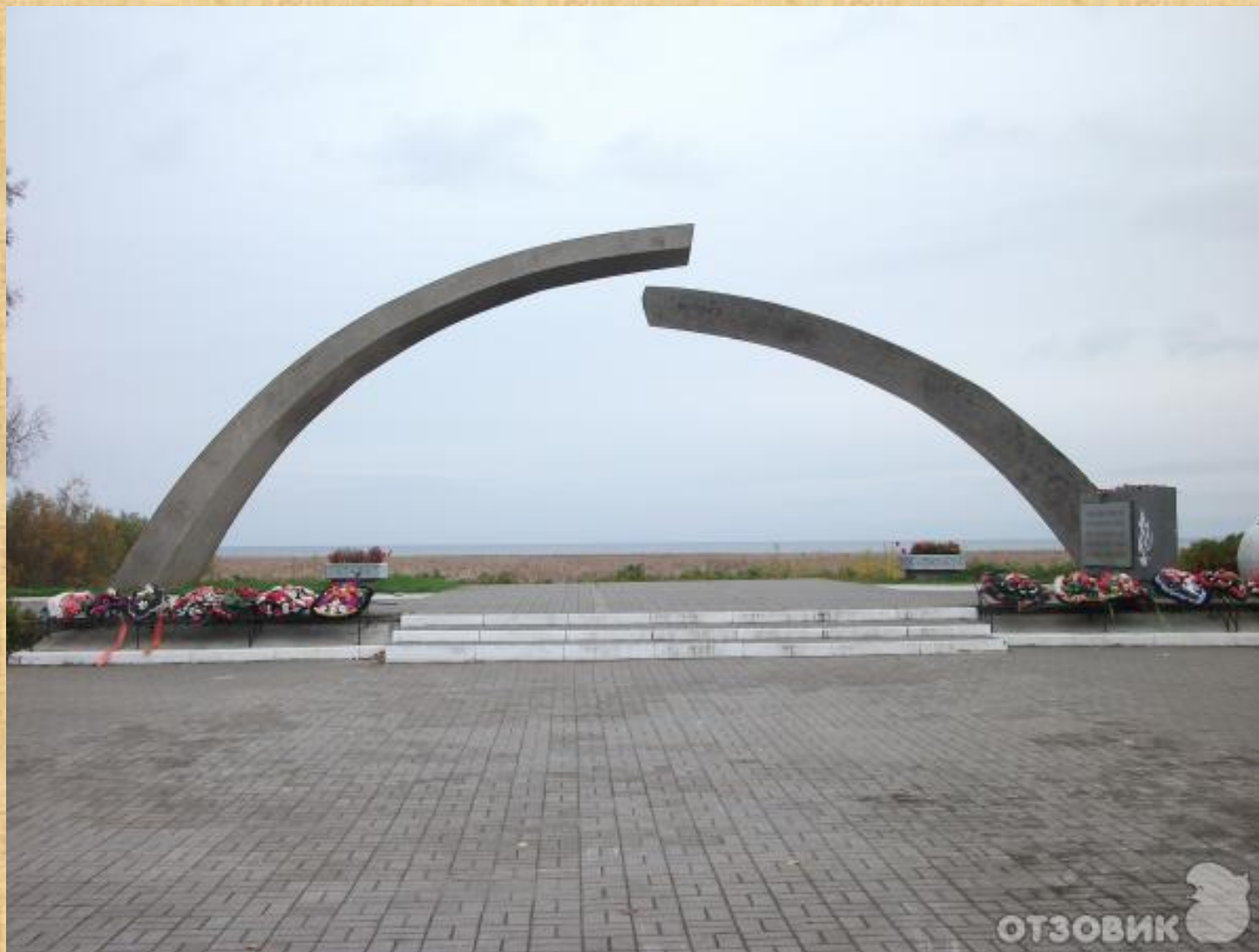
Обелиск на берегу Ладожского озера «Разорванное кольцо»