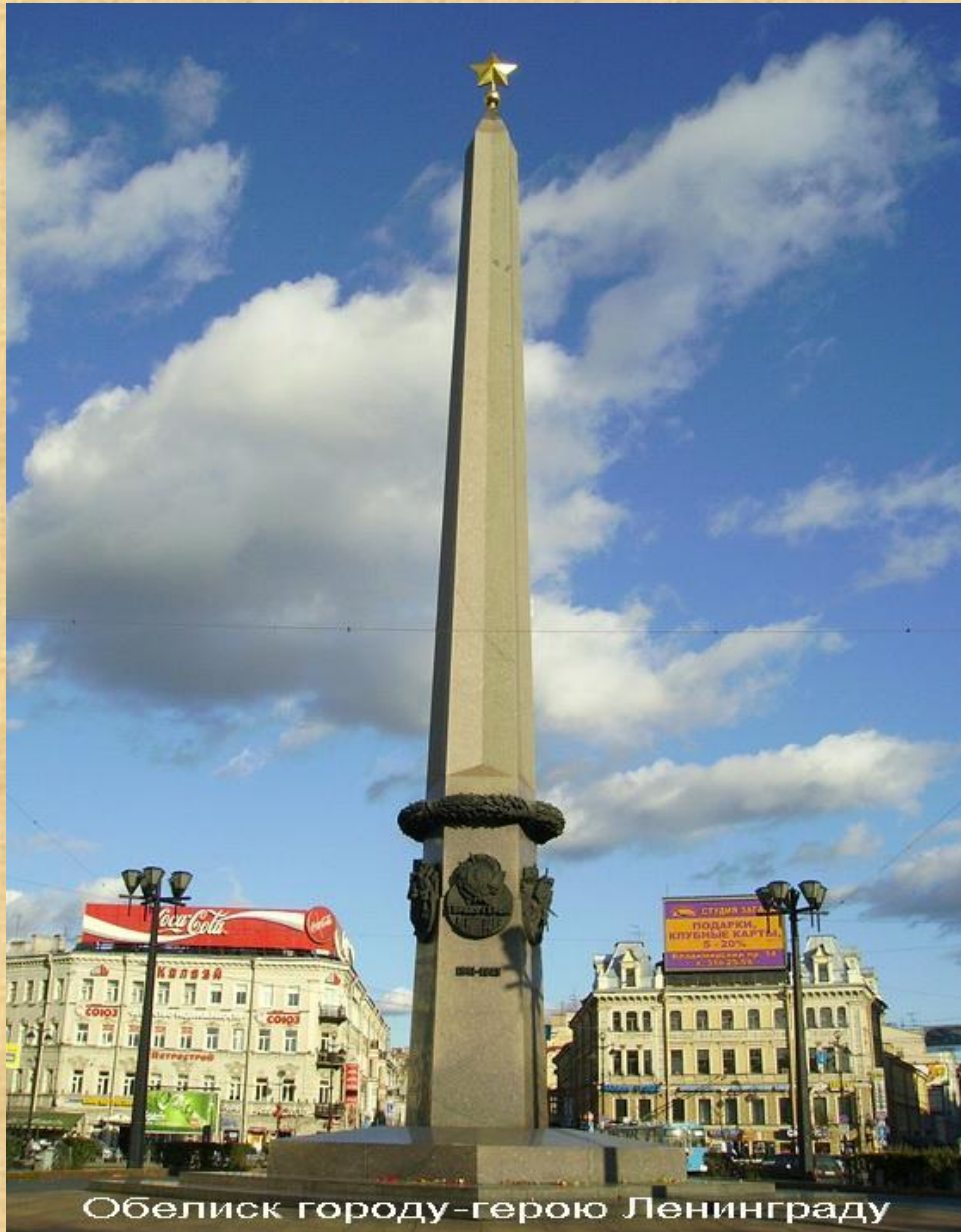
Обелиск городу-герою Ленинграду

В память о массовом героизме участников обороны установлены obelisk «Городу герою Ленинграду» на площади Восстания.