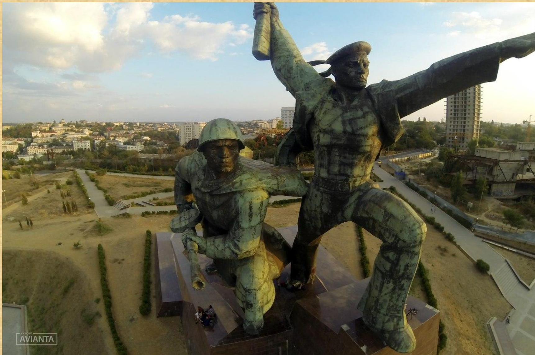
40-метровый памятник «Матрос и солдат»