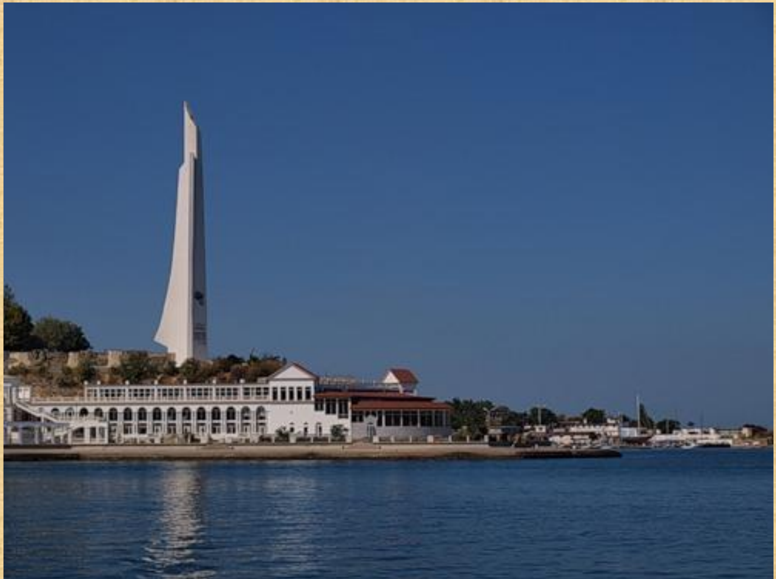
Обелиск «Штык-парус» в честь присвоения Севастополю звания города героя.